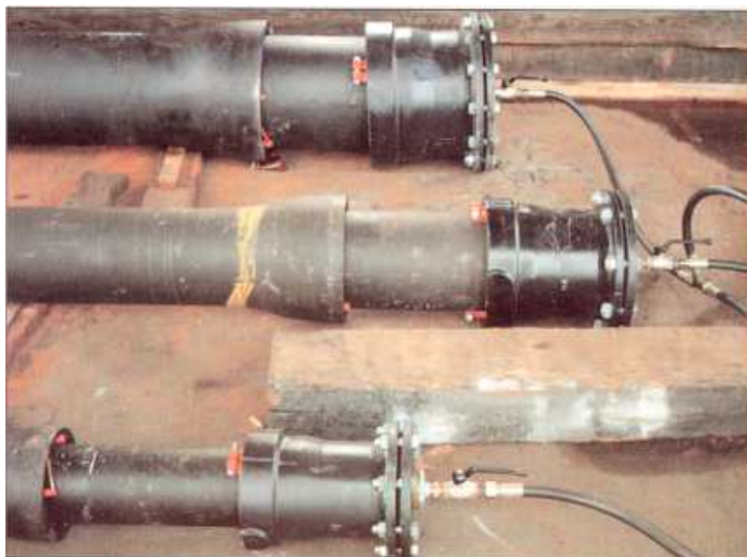
Abgewinkelte Rohrverbindung mit Endverschlüssen durch F und EU Stücke. Sicherung mit Riegel oder Klemmring.

Disposizione per l'esame delle giunzioni tra i tubi e con i pezzi speciali.