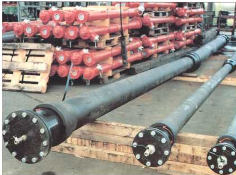
Prüfanordnung der Rohr- und Formstückverbindungen.

Test set-up for pipe and fitting joints.